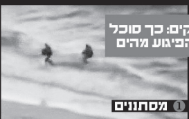
זיקים: כך סוכל הפיגוע מהים